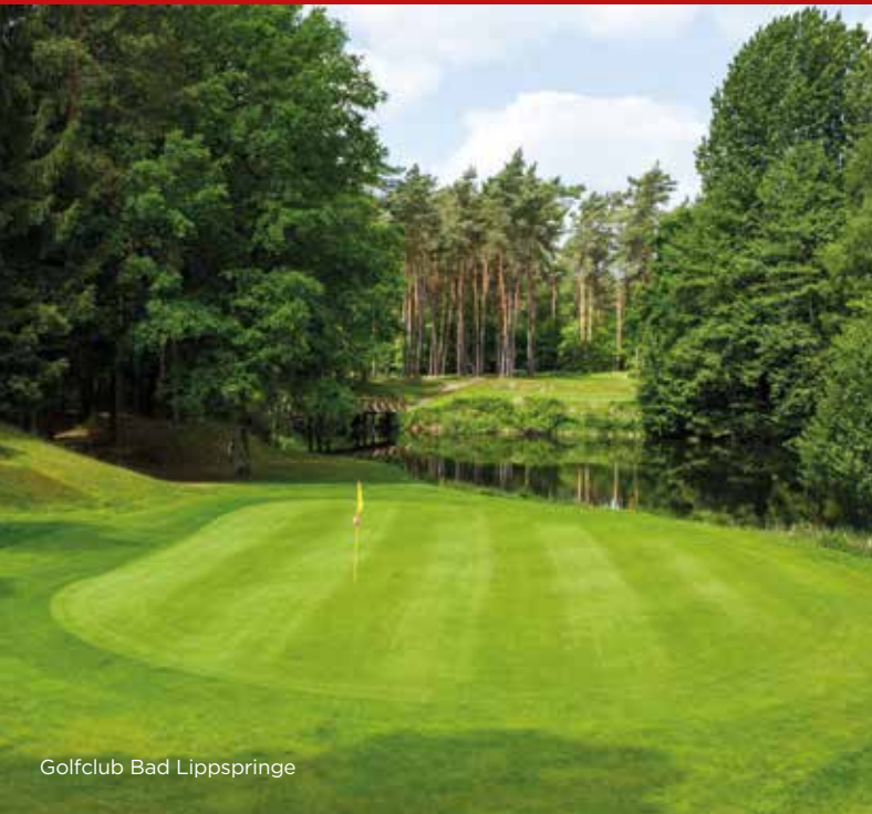
Golfclub Bad Lippspringe