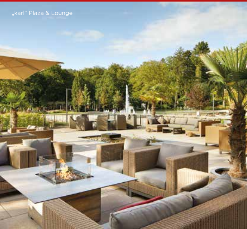
„karl“ Plaza & Lounge