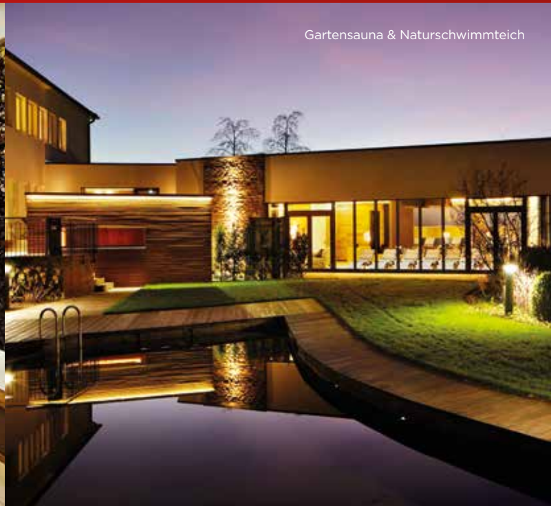
Gartensauna & Naturschwimmteich