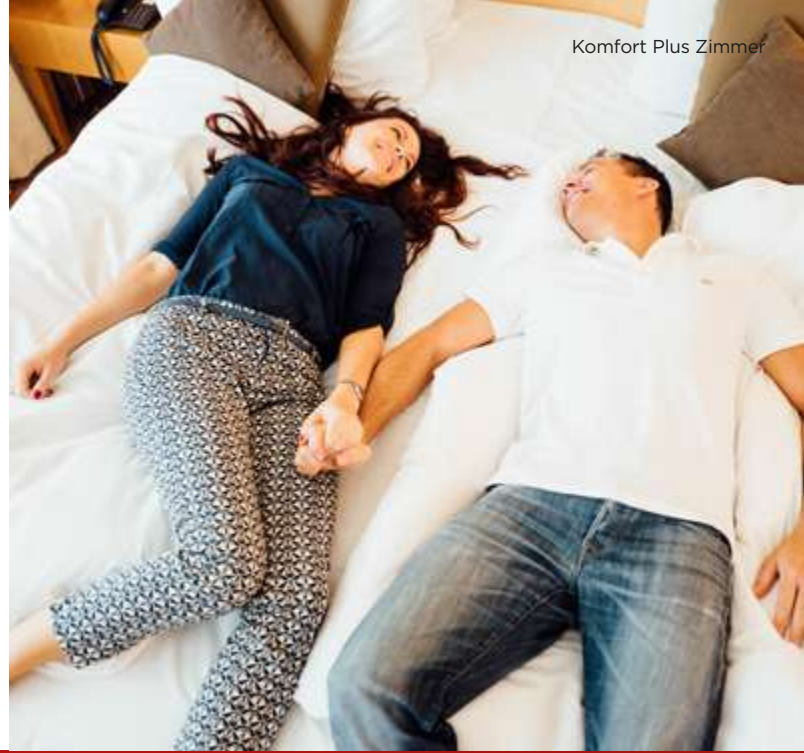
Komfort Plus Zimmer

ab € 129,00 pro Person im Doppelzimmer ab € 189,00 im Einzelzimmer ab € 209,00 im Doppelzimmer zur Alleinnutzung 3. Person im Doppelzimmer: € 85,00