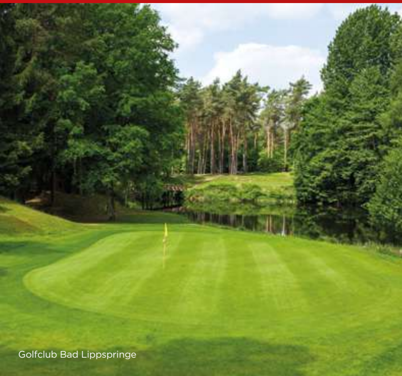
Golfclub Bad Lippspringe