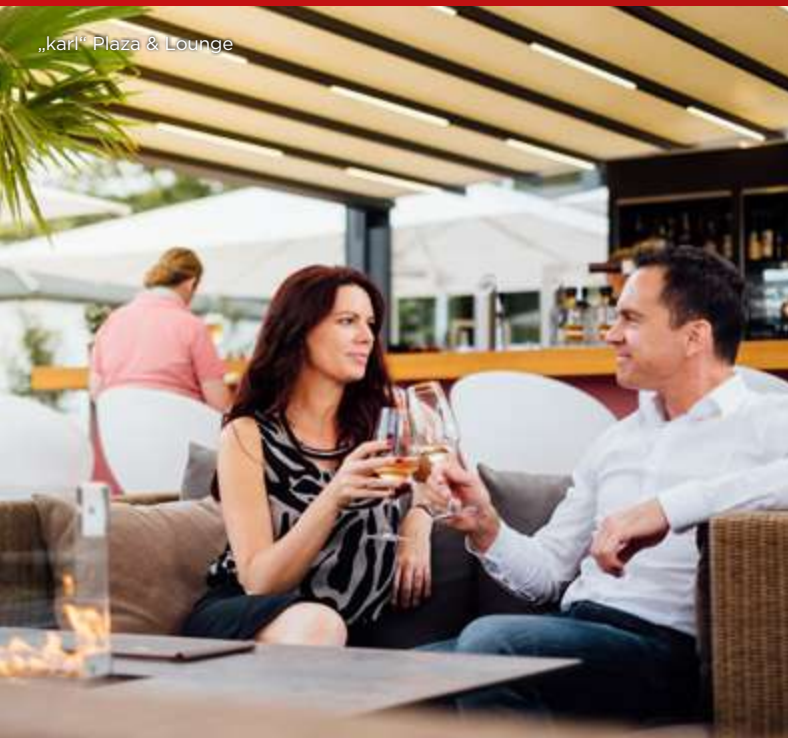
„kari“ Plaza & Lounge